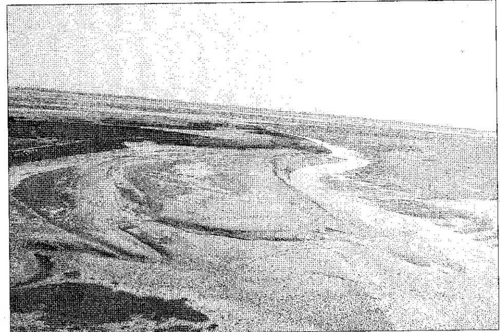
La baie de Somme s'enfonçe dans le sable.

Pour accélérer l'écoulement de l'eau en baie, “il faut créer une pente, comme si l'on soulève le côté d'une table pour en faire